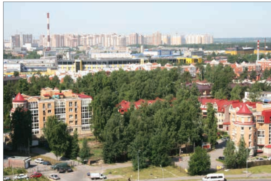
«Архитектура» 3 место - Ускова Светлана