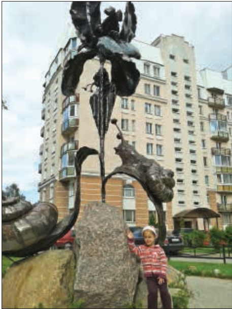
«Архитектура» 1 место - Чудиновских Ирина