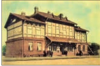
Таким был вокзал в Озерках сто лет назад

роны перрона имело симметричный плоский фасад, отделанный клинкерным красным кирпичом. Цоколь и ступеньки входов вытесали из финского гранита. Над входами в вокзал установили металлические кованые зонтики. По сторонам главного входа с перро-