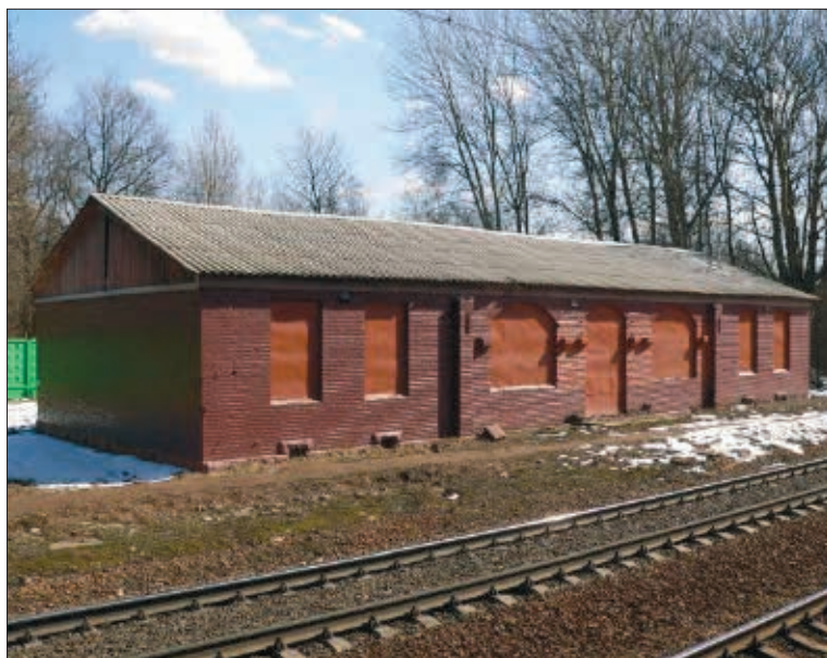
Озерковский вокзал в наши дни

Однако все проекты и предложения так и остались нереализованными, памятное блоковское место по-прежнему находится вдали от туристских троп, а предприниматели и железная дорога упускают возможность восстановить знаменитый ресторан, который несомненно пользовался бы большим успехом у почитателей великого поэта.