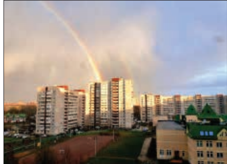
«Архитектура» 2 место - Доронин Игорь