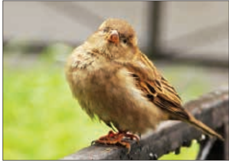
«Природа» 2 место - Горелова Ирина