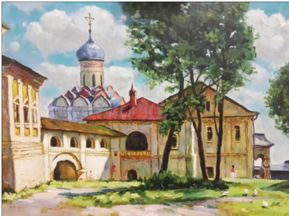
Автор картины — Олег Иванович Глуценко