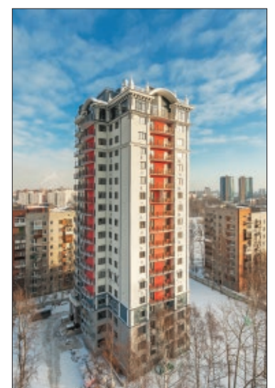
Жилой дом «Бенуа»