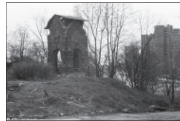
Такой была часовня в 1988 году

...Наступало время перемен, время возрождения веры в России. Внимание к часовне пробудилось в связи с торжественным празднованием в 1988 году 1000-летия крещения Руси. Тогдшний митрополит Ленинградский Алексей (с 1990 года — патриарх Москов-