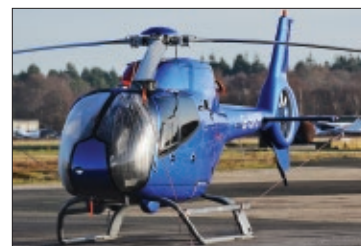
За штурвалом вертолета