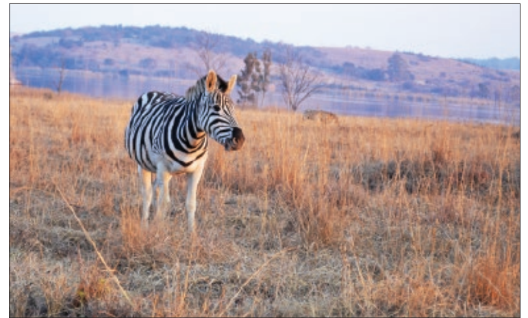
Ближайший родственник квагги, бурчеллова зебра ( Equus quagga ), в Национальном парке в Йоханнесбурге