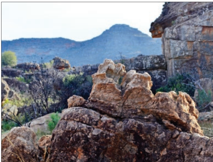
Кедровые горы в окрестностях Кляввиллема