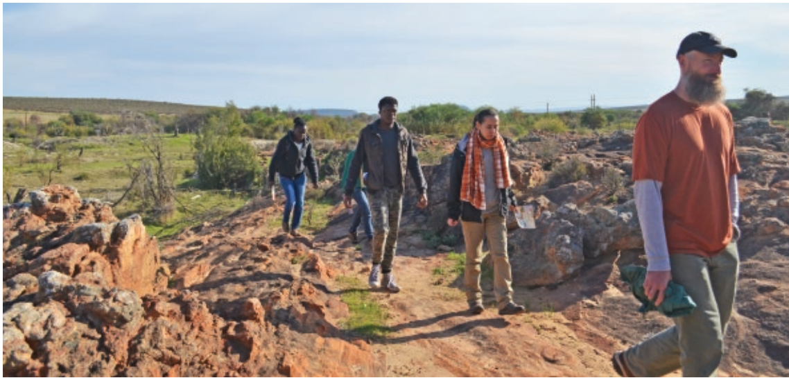
Участники конференции на тропе Sevilla Rock Art, где были обнаружены петроглифы бушменов

Впрочем, главным событием этой поездки всё-таки были не поездки в горы, не экскурсии и даже не посещения местных виноделен. Отправляясь в ЮАР, я боялась, что сама конференция окажется не слишком интересной для меня. Мои опасения развеялись с первым же докладом. Поскольку я никогда не бывала на ботанических конференциях в России, мне сложно сказать, является ли это особенностью южноафриканской науки или ботаники в целом, но только я была приятно способностью докладчиков рассказать о любом исследовании просто и интересно, но при этом так, чтобы у слушателей не осталось сомнений: за этим выступлением стоит долгая и серьёзная работа. Я даже подумала, что поездку на такие конференции стоило бы включить в программу обучения на филфаке — в педагогических целях... Наш доклад тоже вызвал интерес у слушателей, отчасти потому, что мы рассказали о культурной