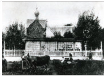
Такой была часовня в 1988 году

Но, не дожидаясь утверждения проекта часовни, коломяжские крестьяне приступили к заготовке материалов