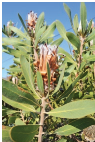
Растение из видов рода Протея ( Protea ), символ ЮАР

Но самым большим открытием для меня стали животные. Те, кто считает, что в Африке гориллы и злые крокодилы на каждом шагу, пали жертвой обмана Корнея Ива-