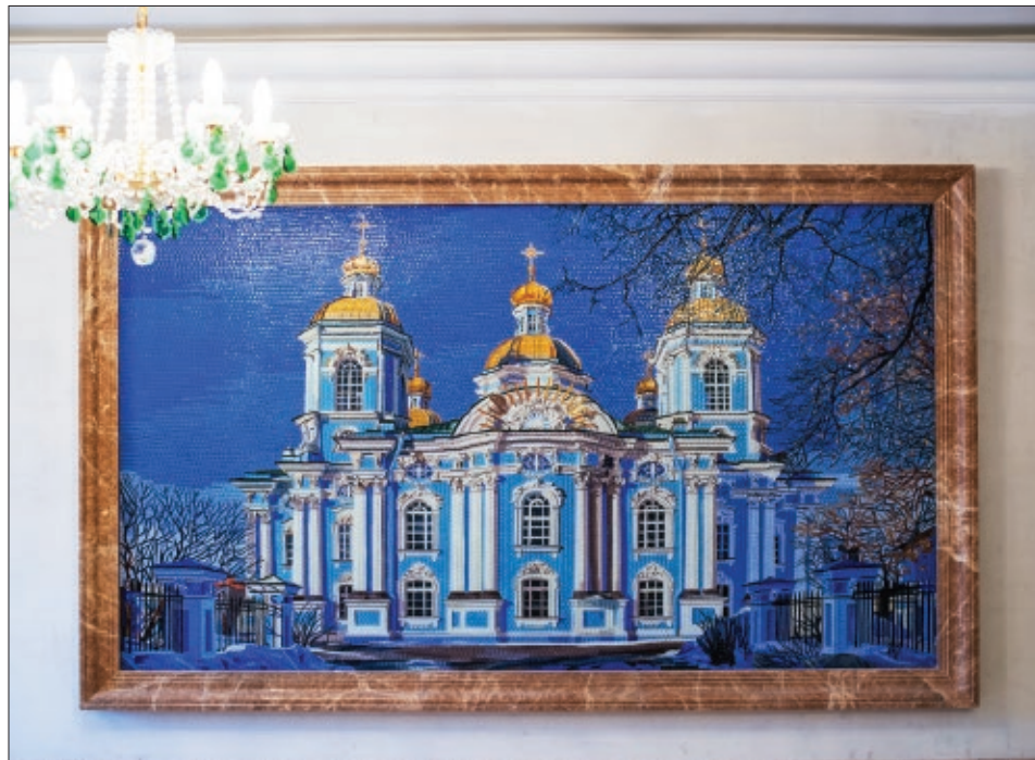
Мозаика «Никольский собор»