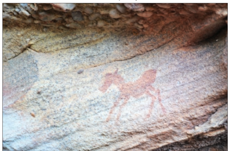
Изображение квагги, подвида бурчелловой зебры ( Equus quagga quagga ) этому рисунку от 800 до 8000 лет последняя дикая квагга была убита в 1878 г.