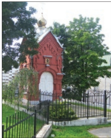
Часовня Александра Невского