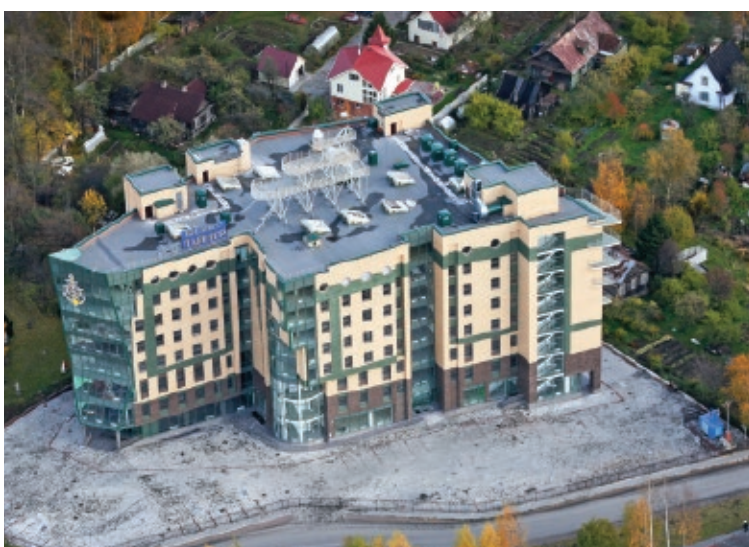
ТЦ «Бизнес-Лайнер». Снимок с вертолета