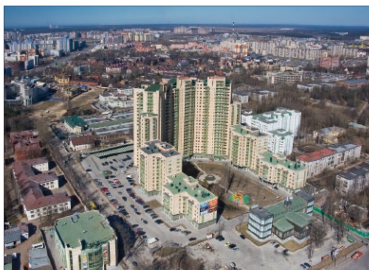
Жилой комплекс «Северная корона» с высоты птичьего полета