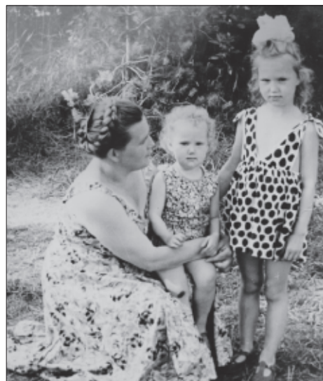
Жена и дочери