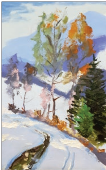
Автор картины — Олег Иванович Глущенко

Олег Иванович родился на Украине в Луганской области, и сразу же после его рождения семья переехала в Россию. Он закончил школу в Ростовской области и решил стать военным. После окончания Севастопольского морского училища служил командиром подводного аппарата. «Это был необычный аппарат с иллюминаторами и манипуляторами, с помощью которых