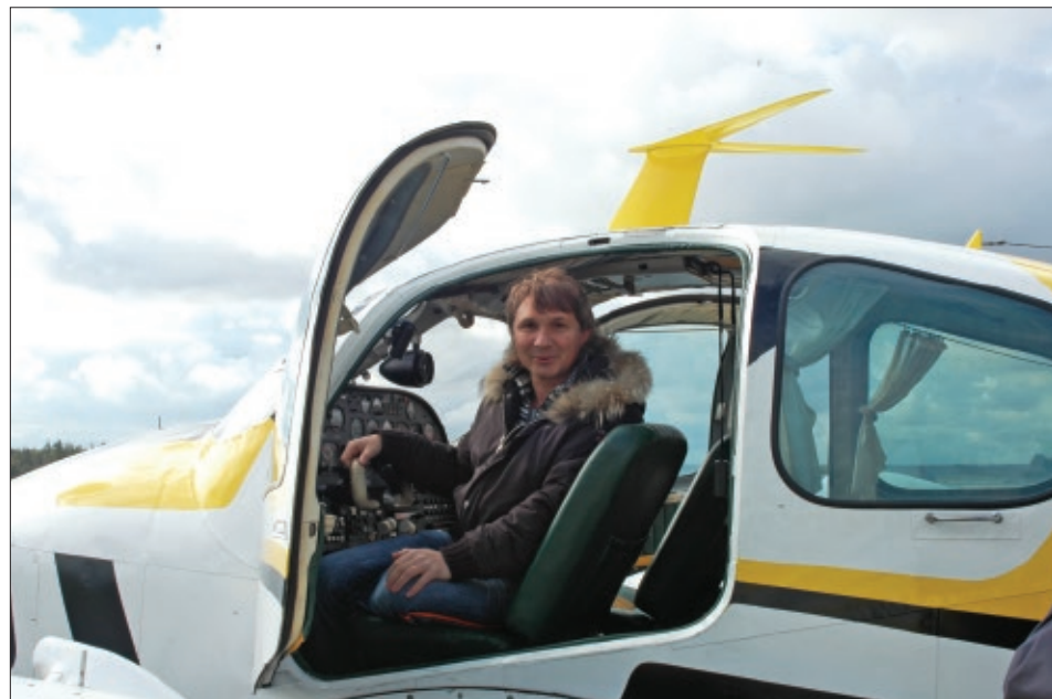
За штурвалом самолета