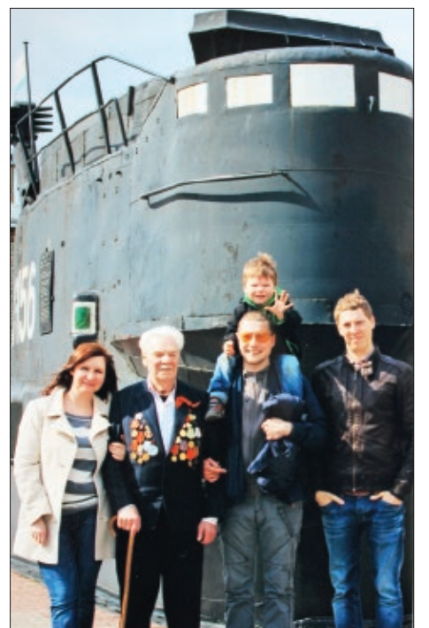
В Кронштадте с внуками