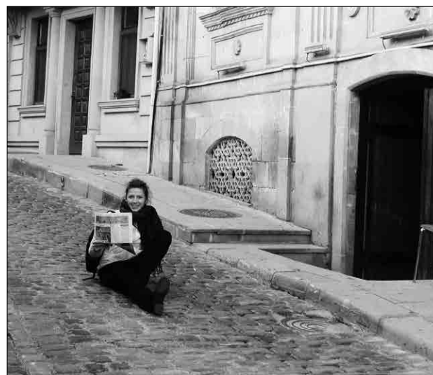
Здесь Андрей Миронов и Юрий Никулин, падая на мостовую, вскрикивали: «Черт побери!»

Вот такой комментарий к своей фотографии оставил читатель, побывавший во Владивостоке: «Я нахожусь на сопке Орлиное гнездо (высота 193 метра) во Владивостоке. Отсюда открывается панорама на акваторию Амурского залива, пролив Босфор Восточный, бухту Золотой Рог и мост «Золотой». В руках «Коломяжские вести», которые проделали путь около 10 000 км. Мостовой переход через бухту Золотой Рог является рекордным в России, в том числе по величине центрального руслового пролета (737 метра). На другой фотографии я на острове Русский, который тоже соединен с Владивостоком другим вантовым мостом. Его протяженность еще больше – 1885 метра, а с подъездами 3100 метра. По протяженности центрального пролета и высоте пилонов он считается крупнейшим среди вантовых мостов в мире. На острове Русский в 2012 году