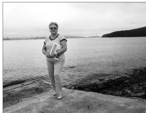
На острове Русский