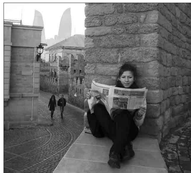
Город Баку, Азербайджан

Фотографии желательно сопроводить краткой историей о себе и о своей поездке. Ждем ваших писем по электронной почте: gazetamo70@yandex.ru с пометкой «Газета путешествует по свету».