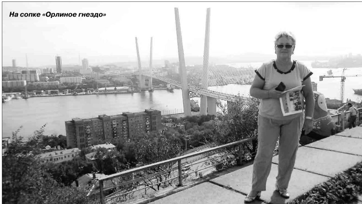
На сопке «Орлиное гнездо»