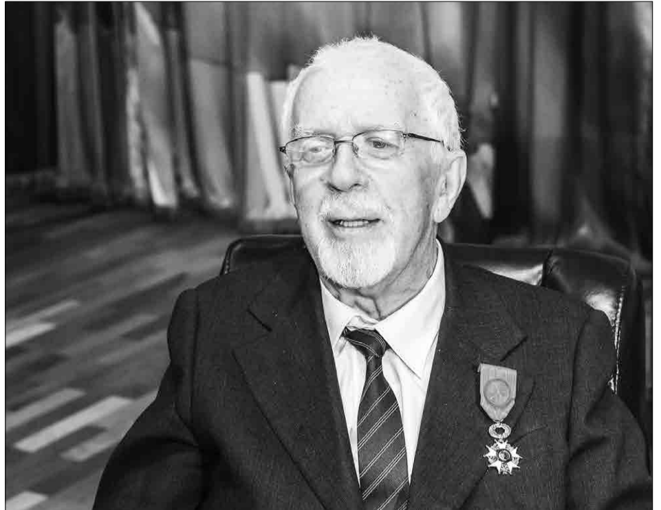
С Орденом офицера Почетного легиона

и организаторов глубокого бурения антарктического ледникового покрова. В результате сотрудничества с Ленинградским горным институтом была создана буровая установка ТЭЛГА-3, успешно испытанная в районе станции Мирный в начале 1969 года. Под его руководством в 1970 году было начато бурение первой глубокой скважины на антарктической станции Восток.