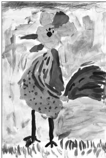
1 место, автор Хохлова Арина

Уважаемые читатели! Подведены итоги конкурса детского рисунка «Петушок – золотой гребешок». В конкурсе приняли участие 26 юных коломяжцев в возрасте от четырех до десяти лет