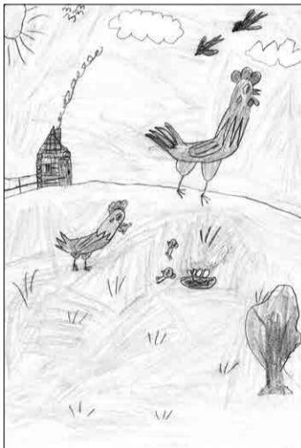
1 место, автор Георгий Путилин