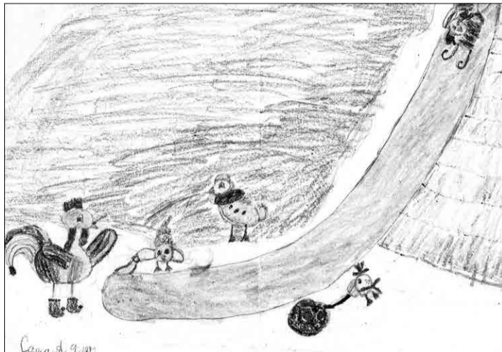
1 место, автор Амелина Александра