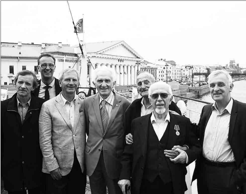
На 90-летнем юбилее Н. И. Баркова