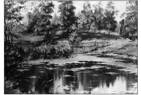
Бабияк В. В. «Старый пруд в Коломязях»