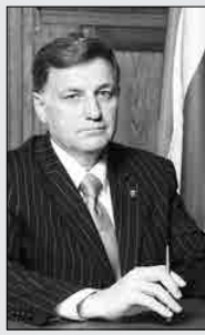
Председатель Законодательного Собрания Санкт-Петербурга, Секретарь Санкт-Петербургского регионального отделения партии «Единая Россия» В. С. Макаров