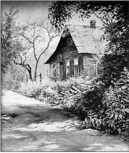
Леонтьев В. В. «Домик в деревне Коломязи»