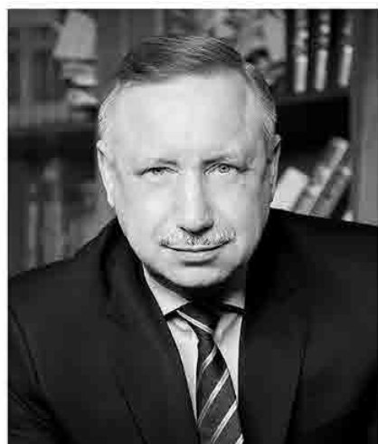
Временно исполняющий обязанности Губернатора Санкт-Петербурга А.Д. Беглов