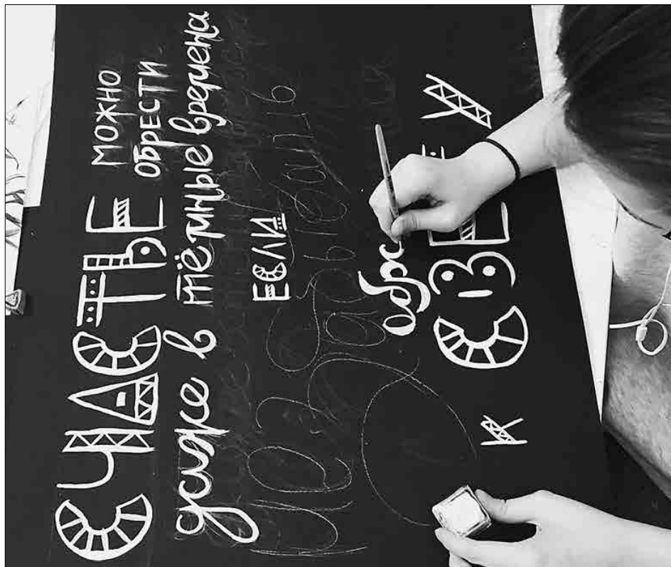
С 12 по 16 марта в Аничковом дворце в комплексе «Карнавал» в 22-й раз состоялся Международный детский конкурс дизайна, изобразительного и прикладного искусства «Комната моей мечты». Академия творчества L'ART, которая находится у нас в Коломязях, тоже приняла участие в выставке, представив работы лартовцев, так ласково называют друг друга преподаватели и ученики