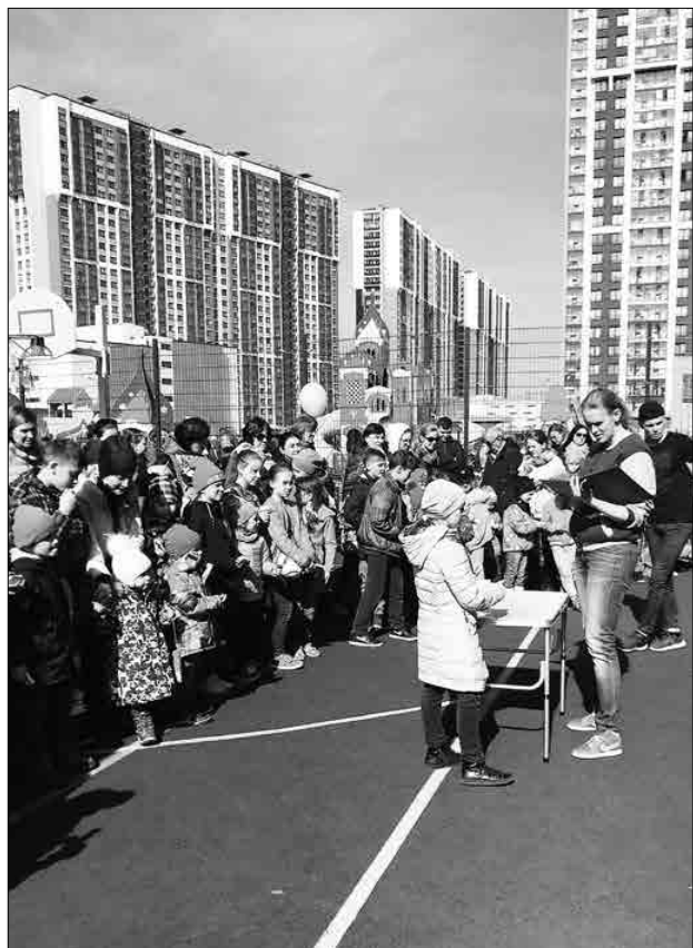
7 апреля активисты Приморского районного отделения «Молодой Гвардии» МО Коломязи совместно с жителями ЖК «Шуваловский» уже в четвертый раз провели детский спортивный праздник