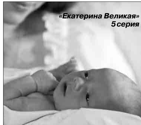
«Екатерина Великая» 5 серия

Во всем мире хорошо известна Книга рекордов Гиннеса. В России тоже есть подобный проект, фиксирующий самые разные удивительные рекорды, поставленные на территории нашей страны, – от наибольшего количества отжиманий до самой высокой канатной дороги в России и даже наибольшего возраста персидского кота