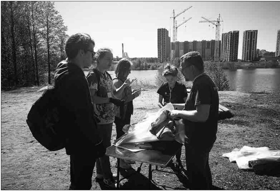
Дачный сезон не помешал активистам нашего округа в выходной день сделать МО Коломязи намного чище. 18 мая на Шуваловском карьере собралось более десяти команд, желавших принять участие в экологических «Чистых играх»