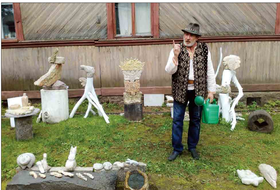
I место в номинации «Люди»