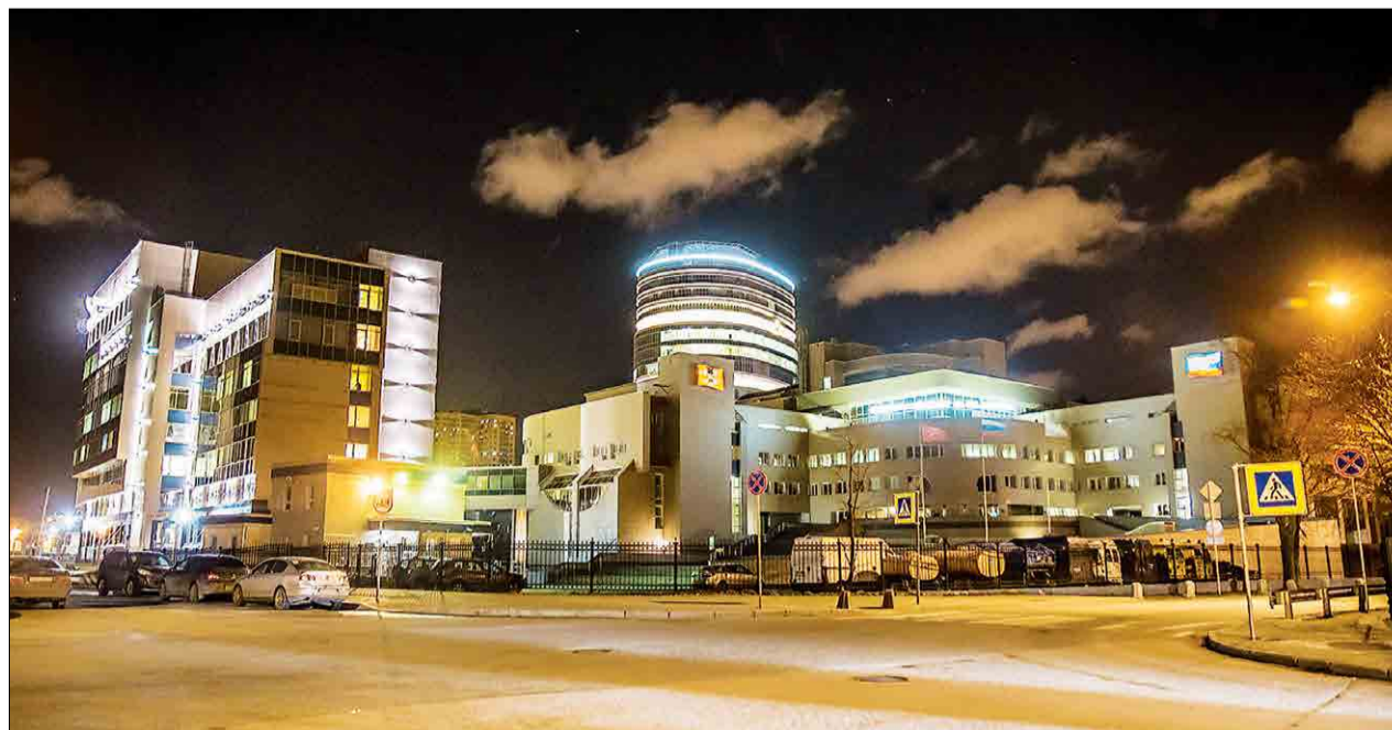
II место в номинации «Архитектура»