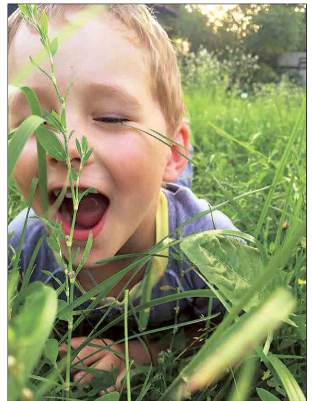
II место в номинации «Люди»