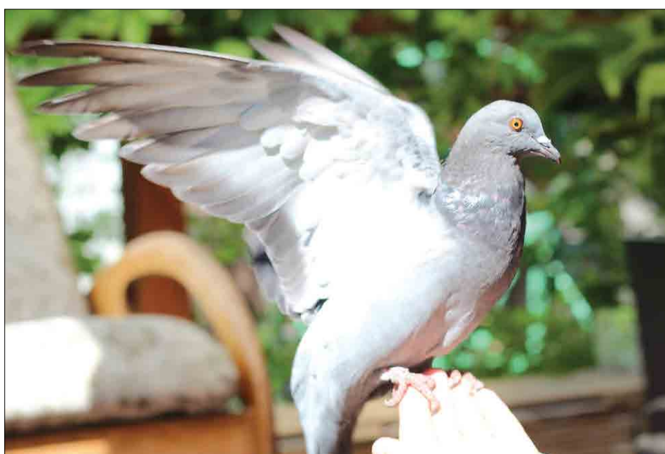
II место в номинации «Природа»