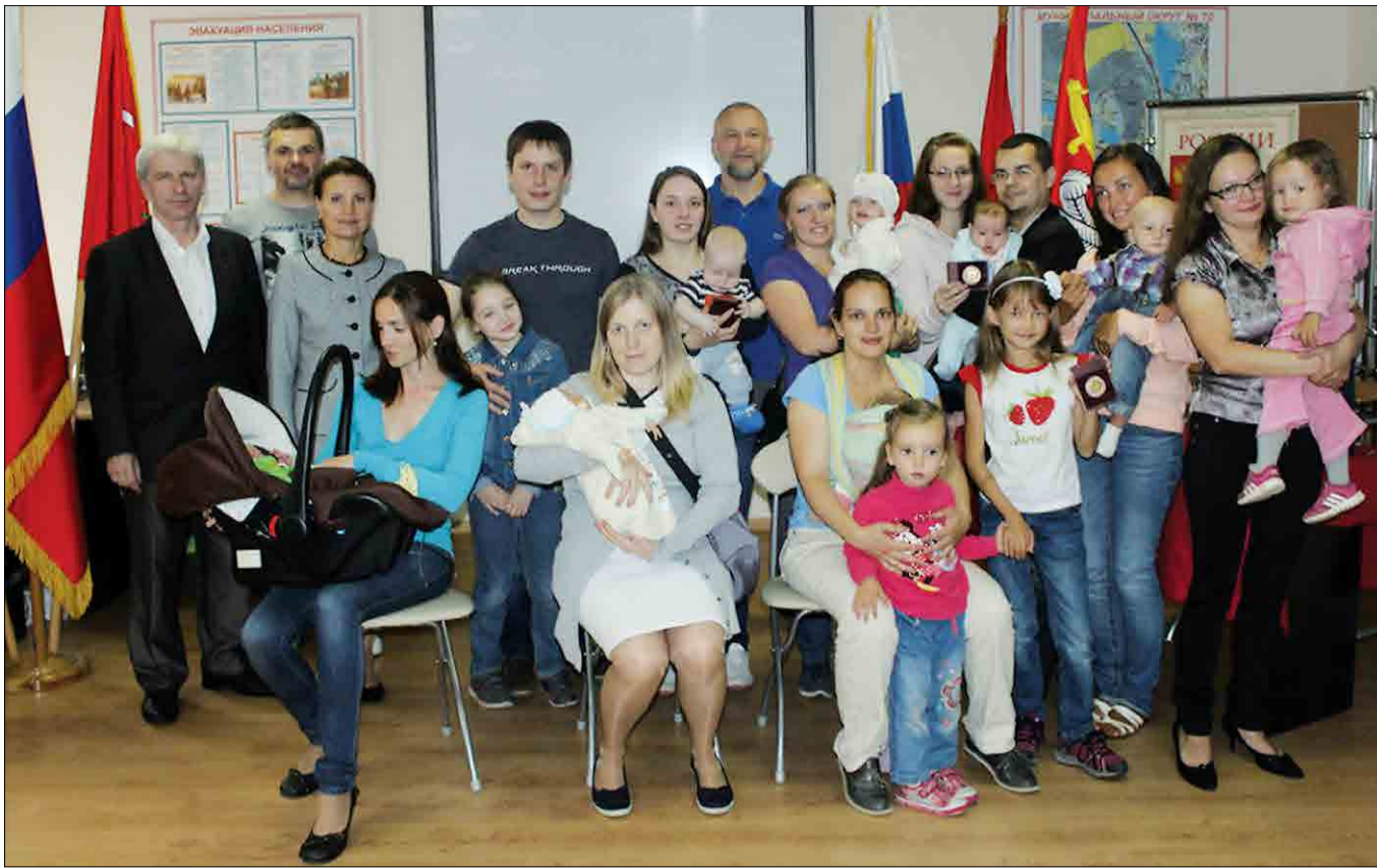
21 июля 2016 года в муниципалитете прошло традиционное мероприятие по вручению медалей «Рожденному в Коломьягах»