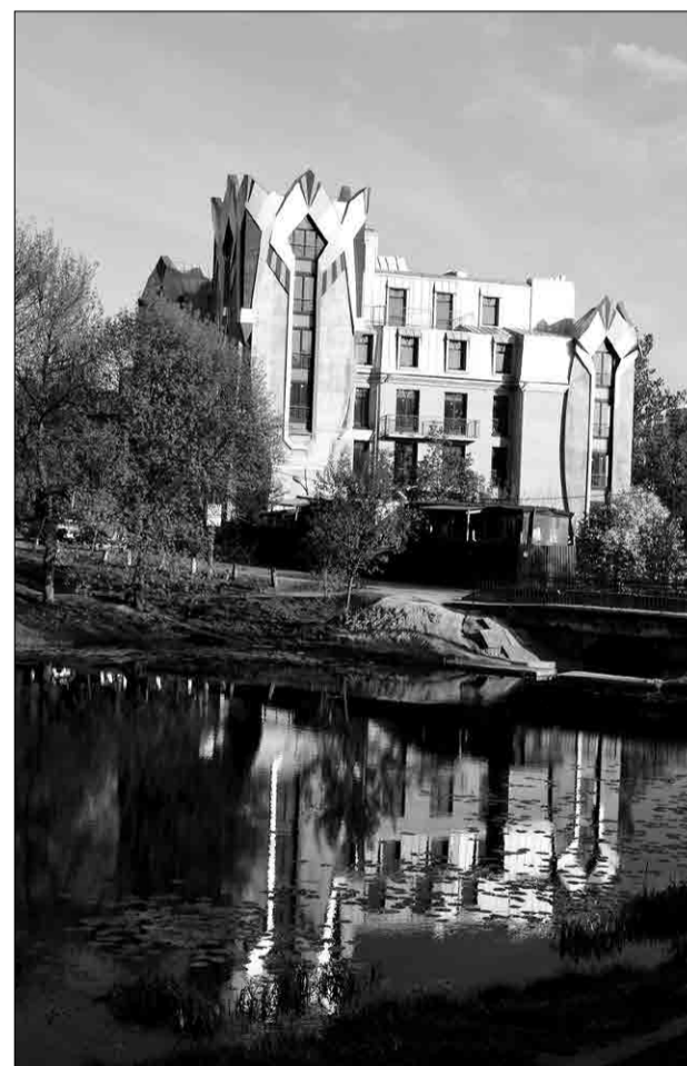
III место в номинации «Архитектура»