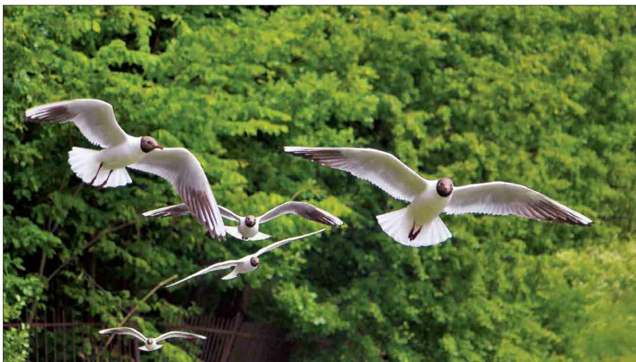
I место в номинации «Природа»