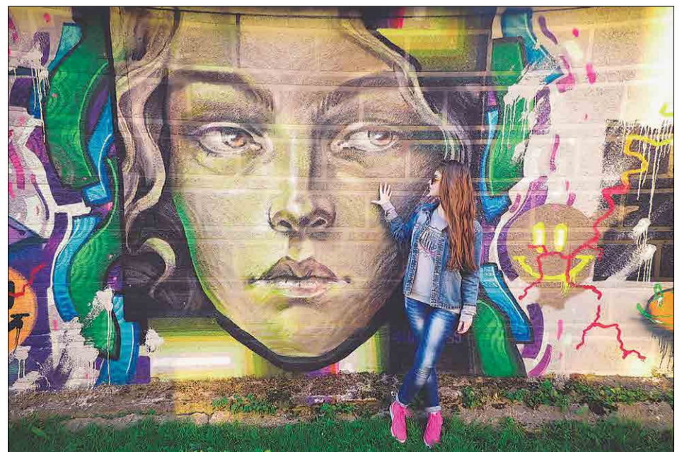
III место в номинации «Люди»