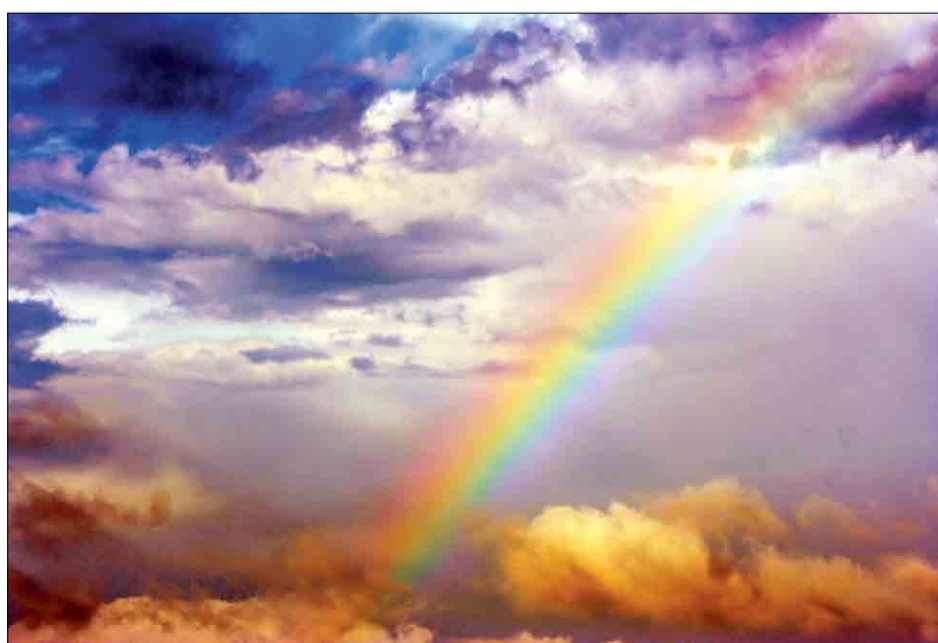
III место в номинации «Природа»