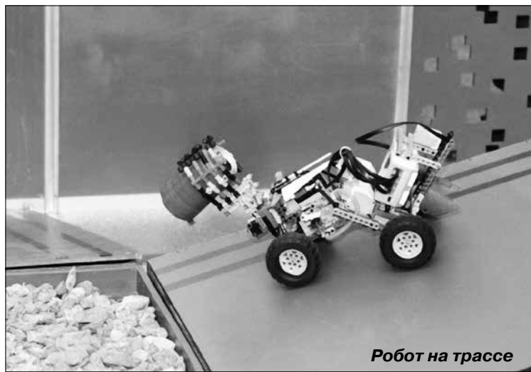
Робот на трассе

Конструкция моего робота была отмечена судьями, но во время прохождения поло-