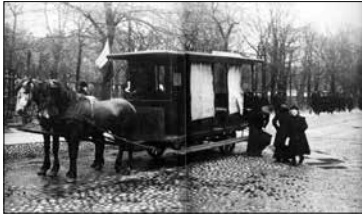
Дилижанс в Петербурге сто лет назад

Когда появилась дорога из Новой Деревни в Коломязи, нынешний Коломязский проспект, сегодня уже не скажет никто. Можно предположить, что это случилось в конце XVIII века. В те давние времена с этой дорогой была связана вся жизнь каждого коломяжца. Своя церковь в Коломязях появилась только в 1906 году, а до этого ближайший храм, Благовещенская церковь, на-