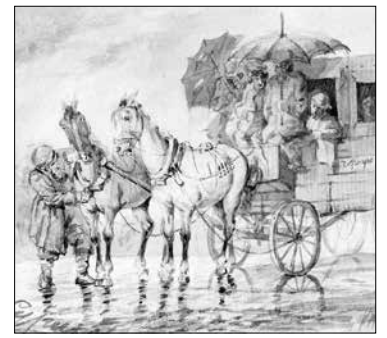
Суриков. Под дождем в дилижансе на Черную речку

С 1878 года по шоссе стали курсировать синие с белой полосой общественные кареты купца Волпянского, запряженные тройкой лошадей. Вот что сообщал справочник «Санкт-Петербург и окрестности» за 1879 год: «Пути сообщения для дачников служат: Финляндская железная дорога и шоссе, соединяющее Коломязи с Черной речкой. По этому шоссе ежедневно ходят дилижансы Волпянского