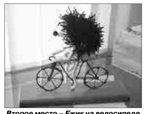
Второе место – Ежик на велосипеде