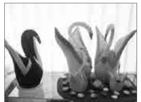
Победители Семейной мозаики – Семья лебедей и Черный принц