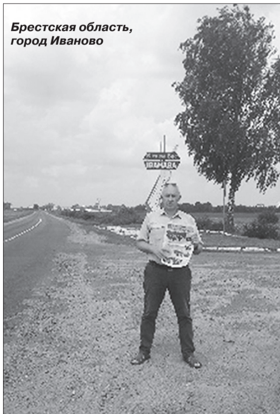
Брестская область, город Иваново

Ивановский район путешественникам очень интересен. Здесь можно увидеть важные пункты Дуги Струве, внесенной в Список Всемирного наследия ЮНЕСКО. Деревня Достоево, Мотоль, Молодово, Мохро и Тышковичи поразят туриста своей самобытностью, культурой и традициями.