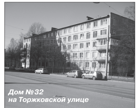
Дом № 32 на Торжковской улице

Только через двадцать семь лет, в 1997 году, П. Б. Луспекаев получил Государственную премию России за художественный фильм «Белое солнце пустыни» – посмертно.