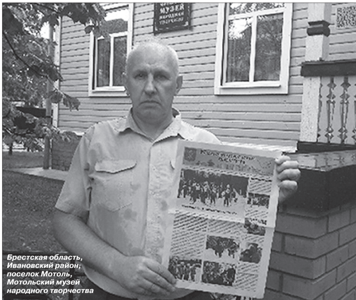
Брестская область, Ивановский район, поселок Мотоль, Мотольский музей народного творчества

«КОЛОМЯЖСКИЕ ВЕСТИ» В РЕСПУБЛИКЕ БЕЛАРУСЬ