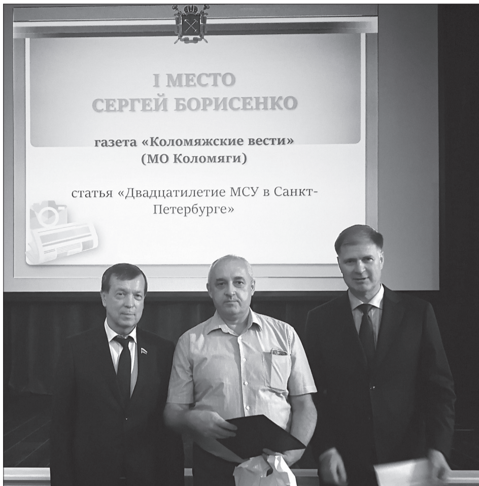
6 сентября 2018 года в Доме журналиста Санкт-Петербурга состоялась торжественная церемония награждения победителей XVII Конкурса муниципальных и районных СМИ, организованного Советом муниципальных образований города и Союзом журналистов Санкт-Петербурга