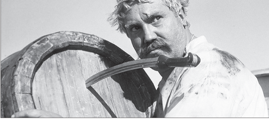
Павел Луспекаев в фильме «Белое солнце пустыни»