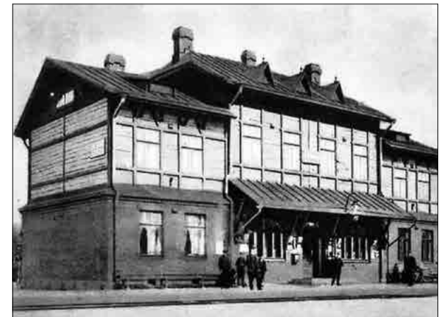
Станция «Озерки» Финляндской ж/д