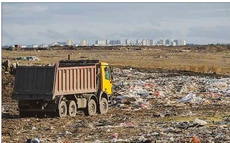
Полигон складирования твердых бытовых отходов (ТБО) в Новоселках существует 47 лет

Изначально его заложили с нарушением технологических правил, не создав бетонную подложку, понадеявшись на глиняный слой, который не лучшим образом защищает водоносные горизонты. Не проложили и трубы станции дегазации, что ежедневно своими носами ощущают жители северных территорий нашего города. В результате мы не получаем энергии от использования свалочных газов (СГ), не можем пользоваться чистой артезианской водой на близлежащих и даже отдаленных территориях, но с избытком страдаем от неприятных запахов, мух и грызунов, не имеем близкорасположенной к выдвинувшимся на север микрорайонам рекреационной зоны в 80 квадратных километров, наши взгляды упираются в малосимпатичный террикон высотой с пятнадцатизэтажный дом, занимающий всю эту площадь, как грандиозный памятник нашей безхозяйственности, недалекости и бездушного отношения к своим гражданам. А главное, непрерывно наносится непоправимый ущерб нашему здоровью в десятки раз превышенной предельно допустимой концентрацией вредных веществ в атмосфере, вызывающих бронхо-легочные, сердечно-сосудистые и онкологические заболевания. Например, по фенолу содержание в воздухе северных территорий Петербурга превосходит норму в 42,4 раза, а этилбензола – в 6,2 раза. При этом 90% выбросов приходилось на полигон «Новосёлки», а остальные 10% – на расположенный там же полигон Водоканала, завод Nissan и другие.