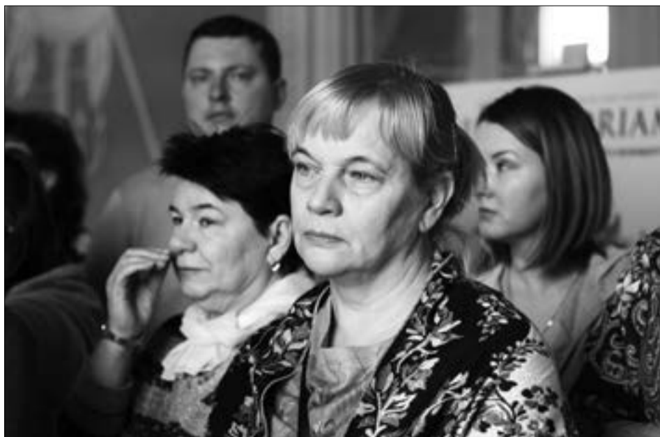
27 февраля коломяжцы посетили Павловск. Экскурсия была организована для всех жителей округа Муниципалитетом МО Коломяги совершенно бесплатно. Любой в возрасте от 18 до 60 лет мог отправиться в путешествие на комфортабельном автобусе в сопровождении опытного экскурсовода

Подобные мероприятия для коломяжцев организуются регулярно. Для того, чтобы стать участником такого мероприятия, необходимо в назначенную дату прийти за билетом. О ближайших мероприятиях и датах получения билетов читайте на стендах округа или в группе в соцсетях http://vk.com/mokolomjagi .