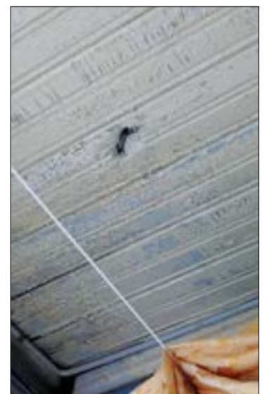
След от осколка на крыше