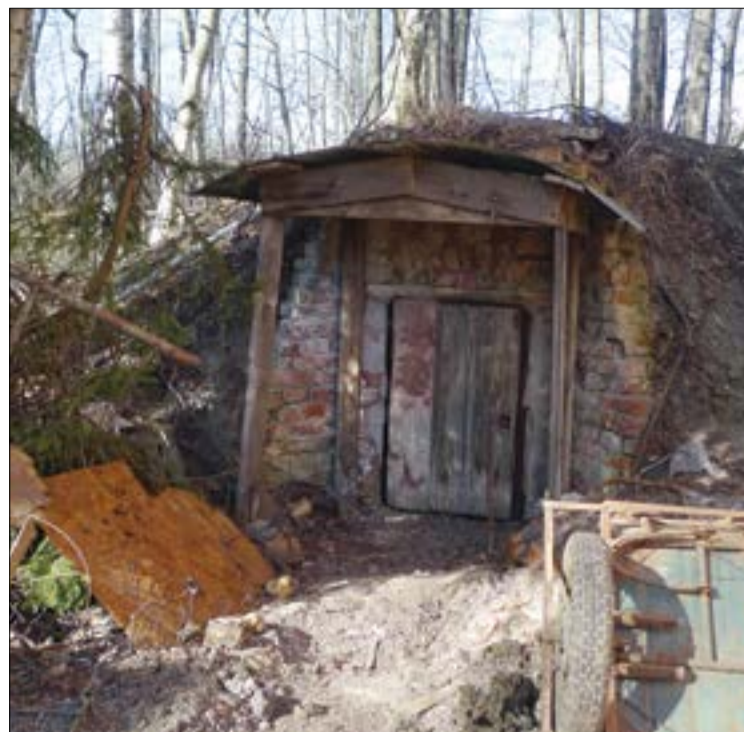
Погреб для хранения овощей