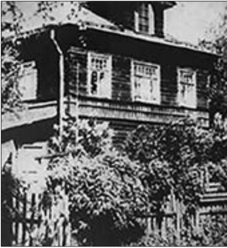
Старинный дом Курбатовых