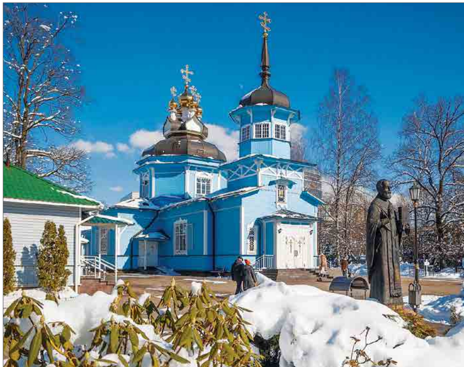
Благовещенские краски весной у храма Димитрия Солунского. Голубой, золотой, белый!