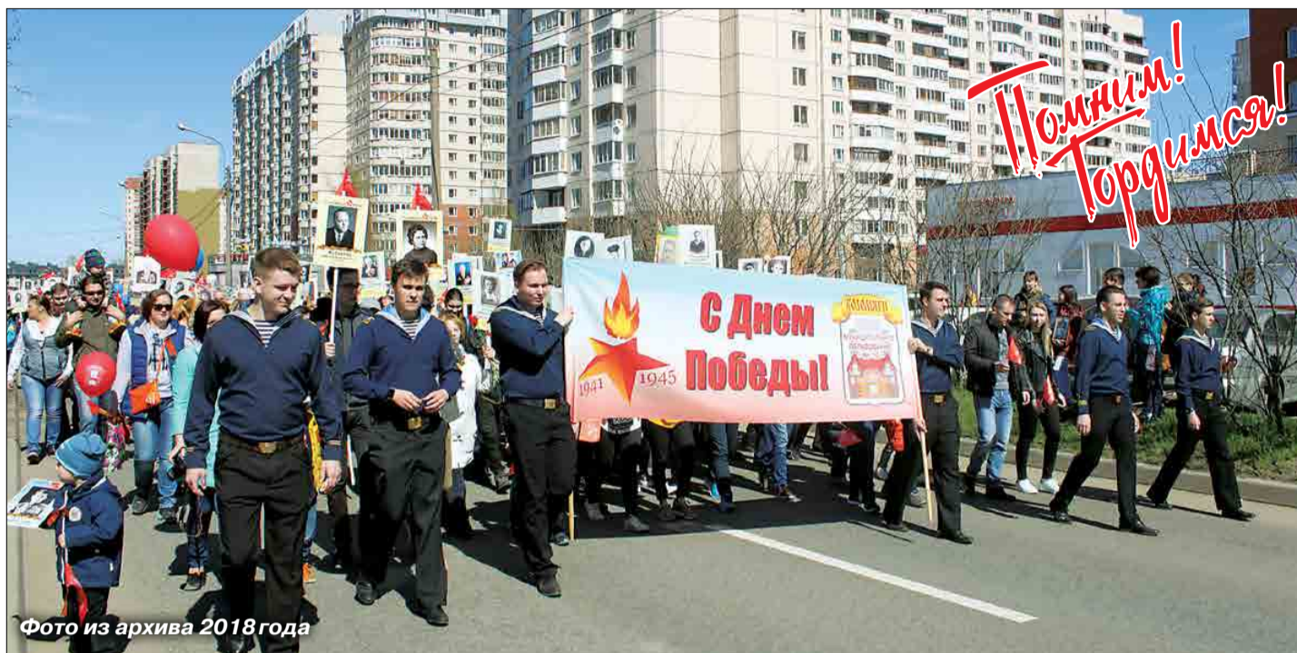
Фото из архива 2018 года

ГАЗЕТА МУНИЦИПАЛЬНОГО СОВЕТА МУНИЦИПАЛЬНЫЙ ОКРУГ КОЛОМЯГИ WWW.MOKOLOMYAGI.RU http://vk.com/mokolomjagi 6+