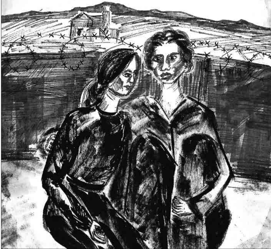
Рисунок выполнила Ксения Агафوشيная, 14 лет

Октябрь только-только наступил. На деревьях пожелтели листья, но радость наступившей осени омрачила Великая Отечественная война.