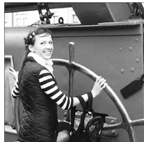
Автор статьи на палубе