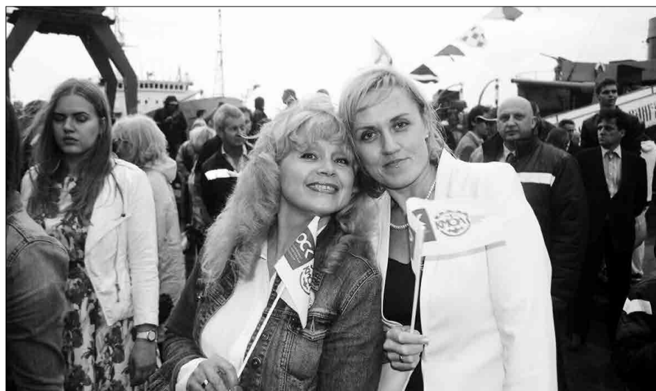
Гости праздника и сотрудники Кронштадтского морского завода