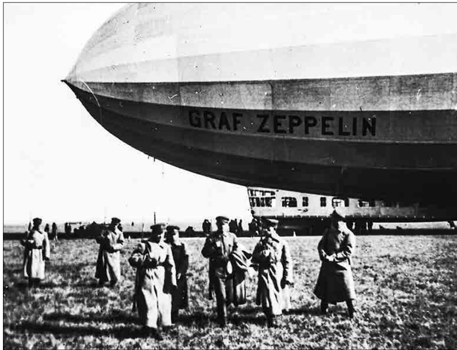
Дирижабль LZ 127 «Граф Цеппелин» во время остановки в Ленинграде

В Ленинграде к приему дирижабля готовились очень тщательно. Место стоянки выбрали первый секретарь партийной организации города С.М. Киров и директор Арктического