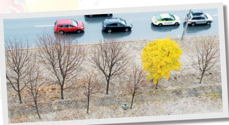
Галина Когут, «Краски осени». Номинация «Природа», I место.

В конкурсе были представлены фотографии более 20 участников в трёх номинациях: «Архитектура», «Природа», «Люди». Всего на конкурс было прислано более 100 фотографий, а самой популярной номинацией в этом году традиционно стала «Природа».