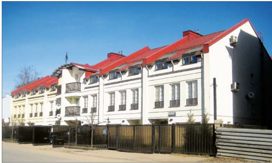
Жилой комплекс «Финский стандарт», он же «Портофино»

А вот его свату Василию Васильевичу Орлову-Денисову довелось поехать на территории Финляндии. В январе 1808 года начинается война со Швецией. Совершив труднейший переход через высокие горы и непроходимые дикие леса по глубокому снегу в тридцатиградусный мороз, русские войска захватывают сильно укрепленную шведскую крепость Борго. Затем лейб-гвардии Казачий полк под командованием В. В. Орлова-Денисова первым вступает в Гельсинфорс (ныне Хельсинки), выбив оттуда шведов. В 1809 году в одном из последних решающих сражений Орлов-Денисов провел два полка конных казаков в метель по льду Ботнического залива, совершил легендарный 100-верстный переход