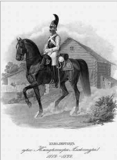
Кавалергард со старинной открытки