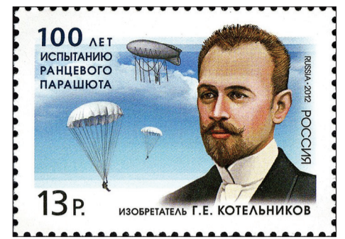
Российская марка посвященная Котельникову