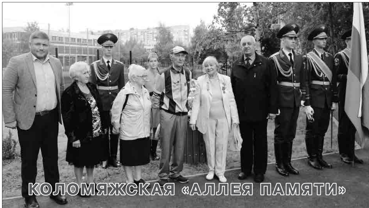
КОЛОМЯЖСКАЯ «АЛЛЕЯ ПАМЯТИ»

ГАЗЕТА МУНИЦИПАЛЬНОГО СОВЕТА МУНИЦИПАЛЬНЫЙ ОКРУГ КОЛОМЯГИ WWW.MOKOLOMYAGI.RU http://vk.com/mokolomjagi 6+