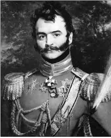
Портрет Василия Васильевича Орлова-Денисова из Военной галереи 1812 года Эрмитажа