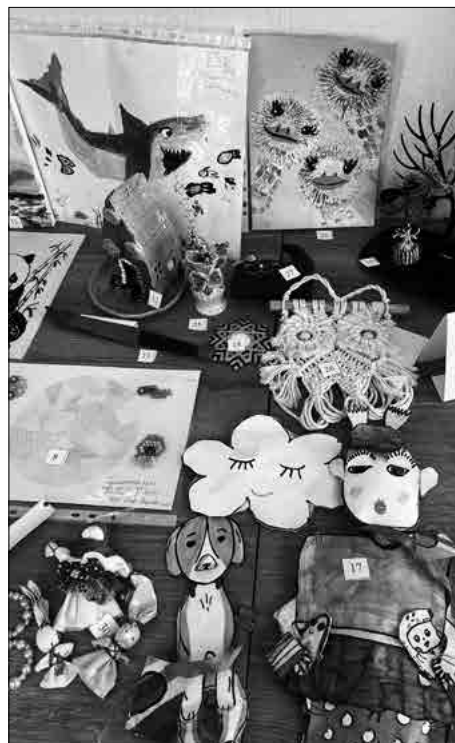
XIV ежегодный конкурс декоративно-прикладного творчества «Семейная мозаика»

Ежегодно в нашем округе проводится множество мероприятий и конкурсов для детей и взрослых, и среди них есть конкурс, который по праву считается долгожителем среди наших мероприятий, это конкурс декоративно-прикладного творчества «Семейная мозаика», который в этом году проводился в 14 раз!