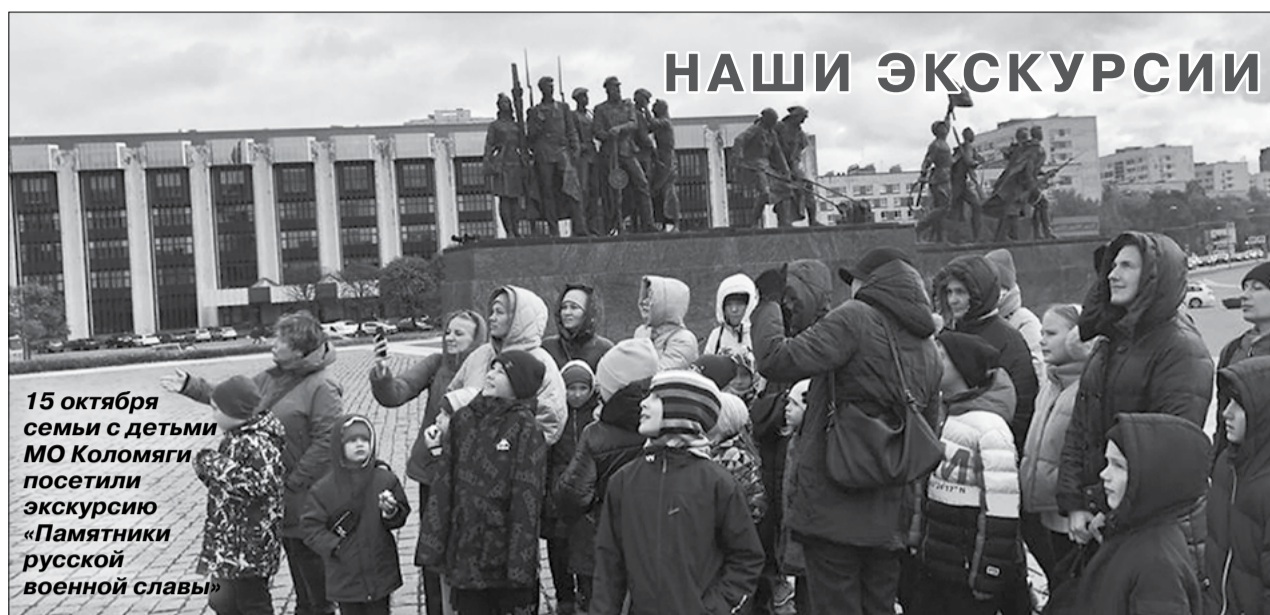
15 октября семьи с детьми МО Коломьяги посетили экскурсию «Памятники русской военной славы»

Жители нашего округа увидели памятник Петру I у Михайловского замка, памятник Александру Васильевичу Суворову, Нарвские триумфальные ворота и Чесменскую церковь. Посетили Мемориал на площади Победы, а также Казанский собор, где погребен русский полководец Михаил Илларионович Кутузов.