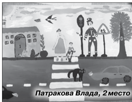
Патракова Влада, 2 место