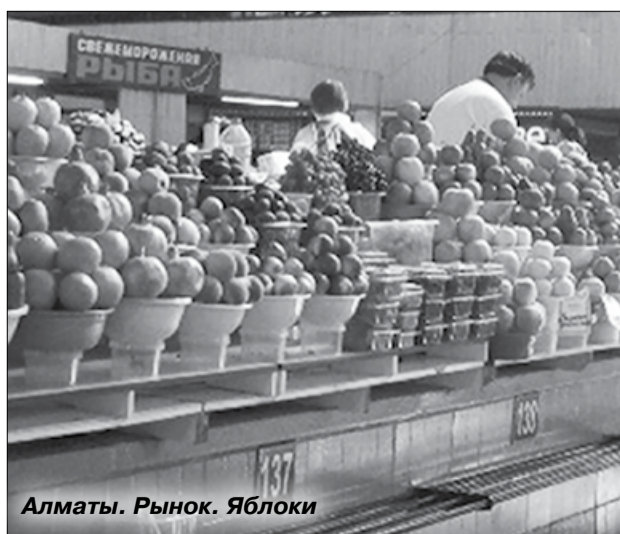
Алматы. Рынок. Яблоки