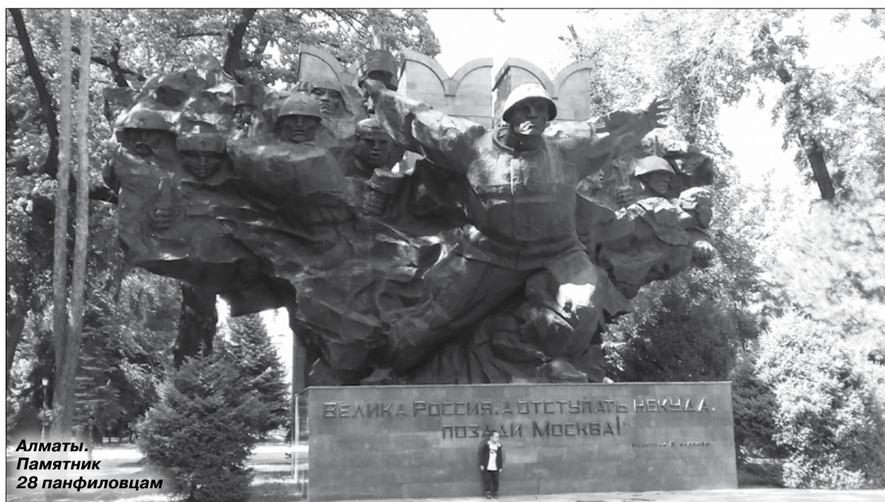
Алматы. Памятник 28 панфиловцам

Выехали из Алматы, здесь же и завершилась программа тура знакомством со старой столицей. В городе хранят памятные места, связанные с древними легендами, с Великой Отечественной войной – Панфиловцами. Дивизия формировалась в Алматы, в основном, но не только, из жителей Казахстана и Киргизии. Её командир, И. В. Панфилов, был заботлив (пишут, что на стенах рейхстага были надписи: «Мы – воины-панфиловцы, спасибо, Батя, тебе за валенки»), имел военный опыт, знал нравы, обычаи, языки азиатских народов. В нынешние, неспокойные времена, уточняют различные детали событий – не 28 было «панфиловцев», не все погибли, не все геройски и т.п. Что ж, и эти вопросы имеют право на поиск ответов. Помнят и разгон мирной демонстрации в 1986 (Желтоксан).