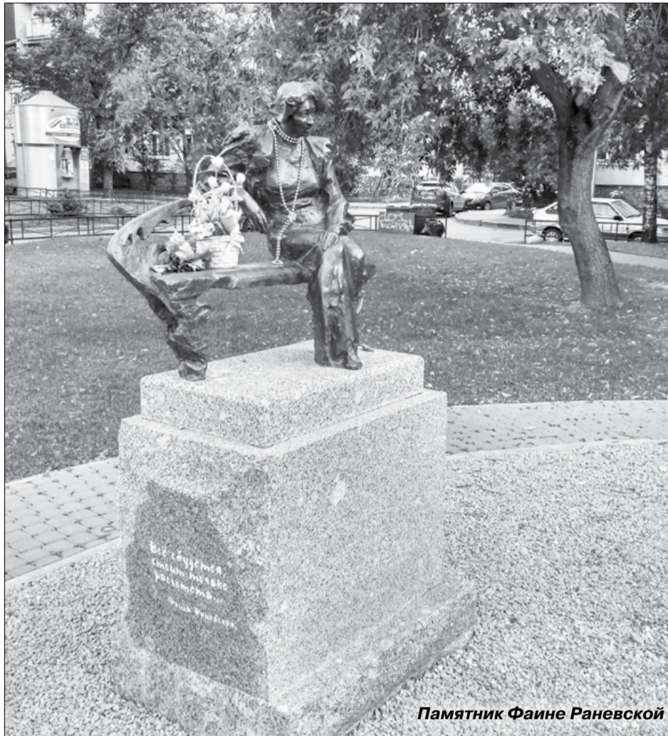
Памятник Фаине Раневской

Надо сказать, что жители близлежащих домов неоднозначно отнеслись к появлению новой достопримечательности. Многие