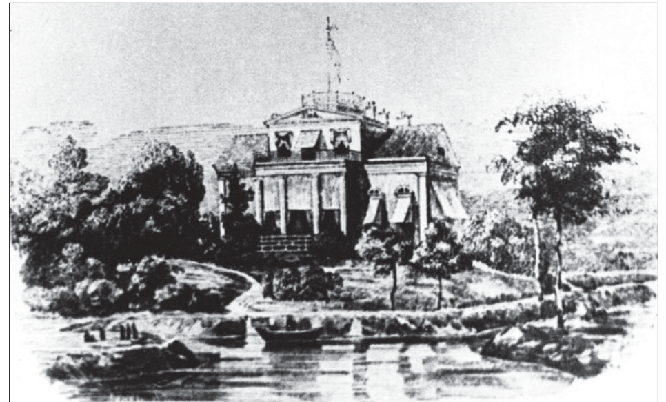
Усадьба в Коломягах. Рисунок из журнала «Иллюстрация». 1845 год

Целый абзац статьи от 13 июля посвящен Коломягам: «Верстах в трех за