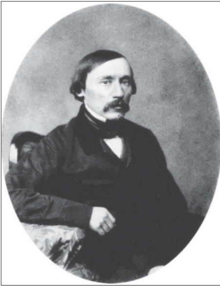
Н. А. Некрасов. 1850-е годы