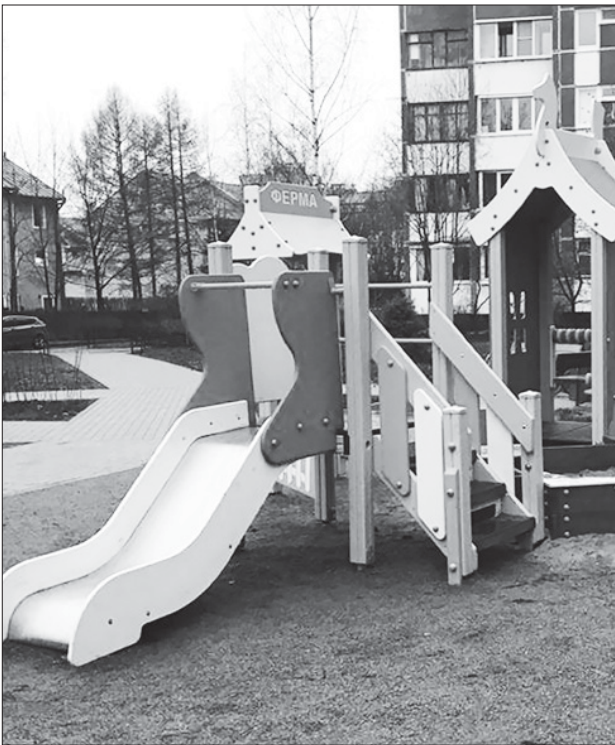
Выполнены работы по благоустройству территории с заменой игрового оборудования во дворе дома 13 по Вербной улице