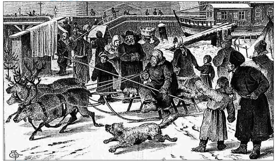
Сцены на Неве во время зимы. Середина XIX века