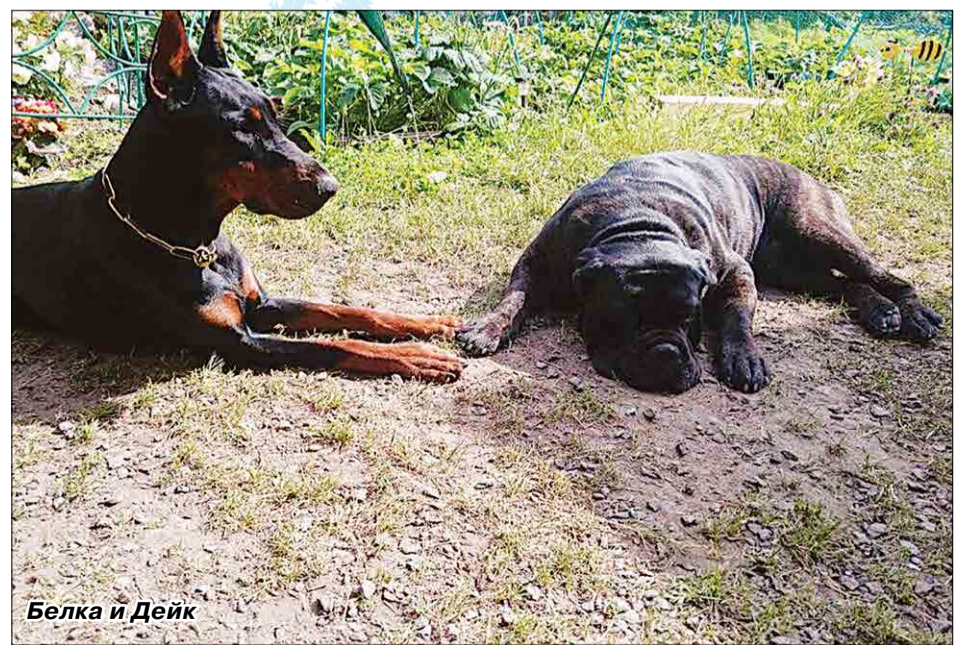
Белка и Дейк