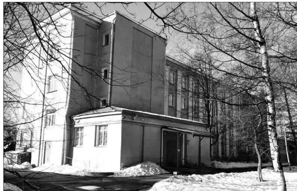
Школа на 3-й линии первой половины

Но сомнений ни у кого не было, вернулись, ощущая себя на творческом пике, но дома их ждали печальные новости, вместо чествования победителей они услышали в свой адрес следующее: «ребята, что-то очень долго были на гастролях, так что вы лишили себя помещения». Оказывается, за время их отсутствия было принято