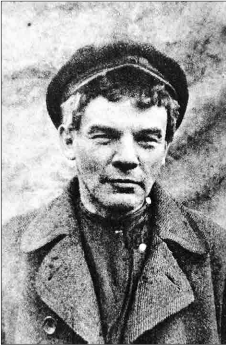
Ленин в июле 1917 года