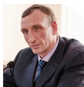
А.Н. Козловский Первый заместитель председателя ОАТОС, депутат Государственной Думы Федерального Собрания РФ