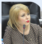
И.А. Грибанская Начальник управления по работе с населением города Калуги