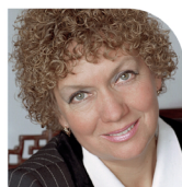
О.А. Уржа Член Федерального экспертного совета по местному и общественному самоуправлению и местным сообществам при ОАТОС, академик РАЕН, д.социол.н., профессор Российского государственного социального университета