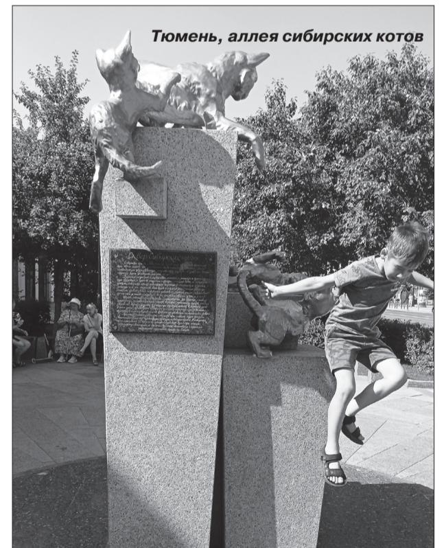
Тюмень, аллея сибирских котов