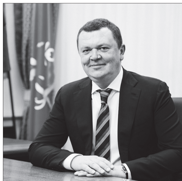
Глава администрации Приморского района Никоноров Алексей Владимирович