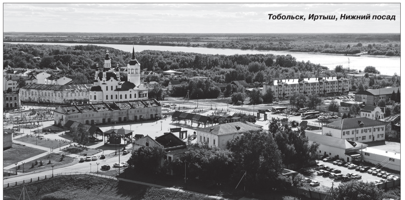
Тобольск, Иртыш, Нижний посад