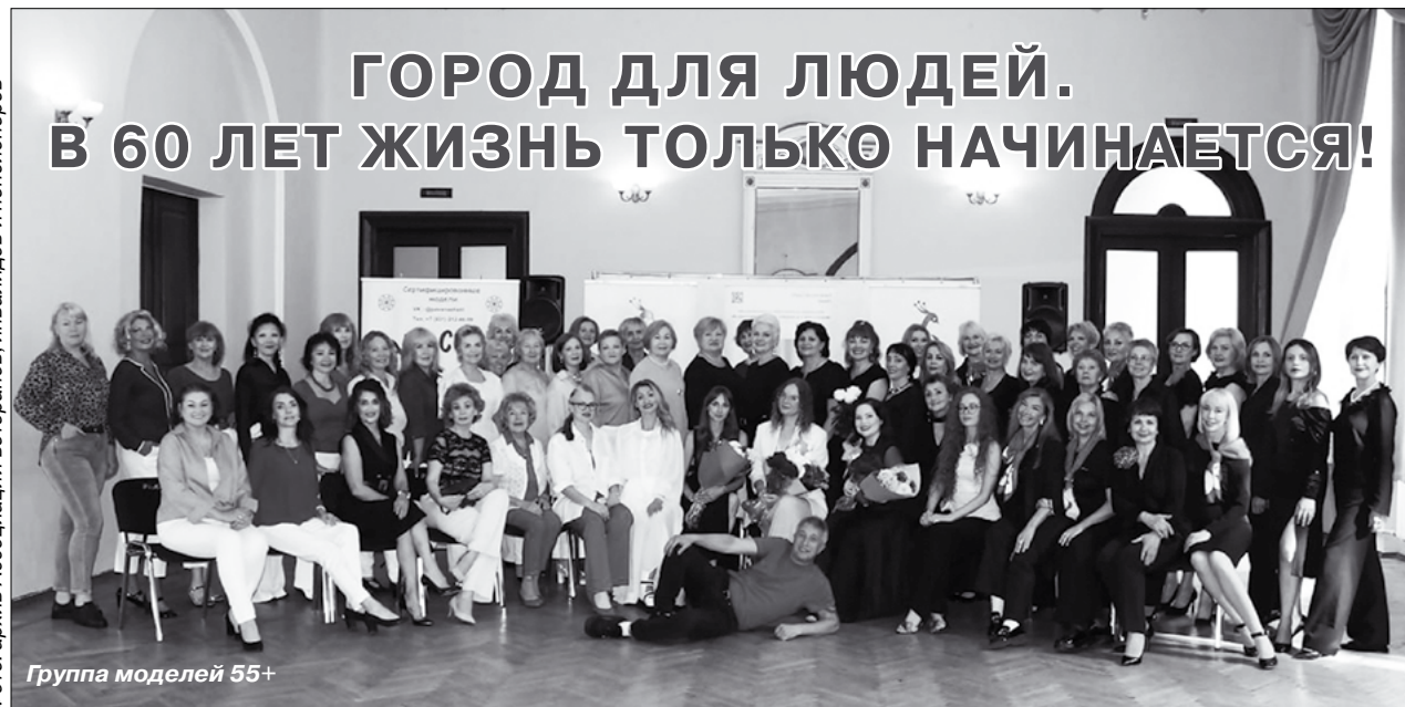
Группа моделей 55+