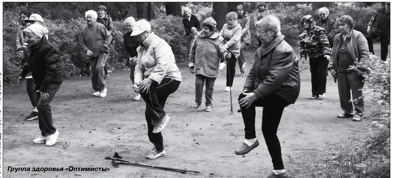
Группа здоровья «Оптимисты»

Тем, кто привык следовать завету «учиться, учиться и еще раз учиться», придется по душе новая система профессиональной переподготовки пожилых людей «Серебряный университет». В партнерстве с городскими колледжами (в режиме онлайн и офлайн) будут реализовываться программы, по которым петербуржцы старшего возраста смогут освоить профессии экскурсовода, няни, сиделки, специалиста по здоровому питанию и даже – для самых «продвинутых» – графического дизайнера и создателя веб-сайтов. Эти программы будут корректироваться ежегодно, с учетом, опять же, актуальных запросов жителей.