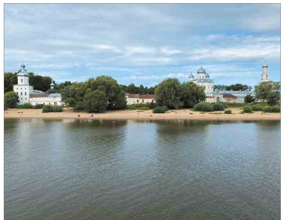
Великий Новгород с Волхова