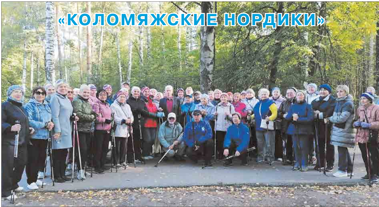
01 октября в Удельном парке Центр физкультуры и спорта Приморского района провел фестиваль по скандинавской ходьбе, посвященный Дню пожилого человека. В мероприятии приняли участие 64 жителей нашего района, в том числе и группа «Коломяжские нордики»

Представители Коломяг заняли призовые места в каждой номинации: