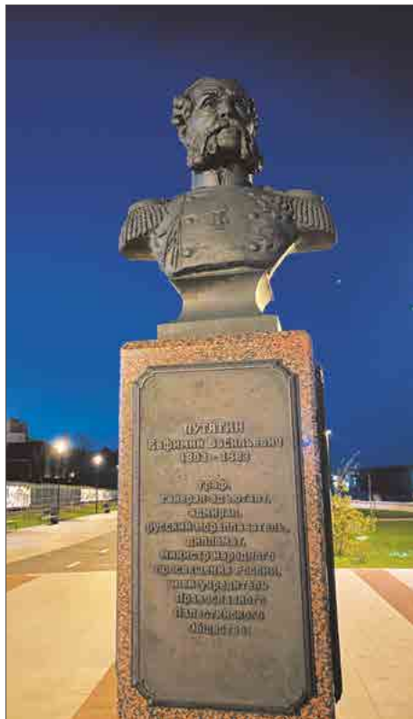
Путятин Евфимий Васильевич, адмирал, дипломат