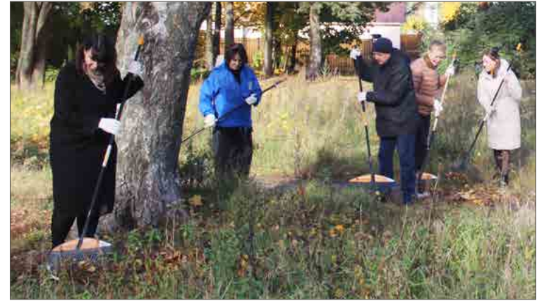
С 01 по 31 октября 2024 года в нашем городе проводится осенний месячник по уборке и благоустройству территорий

Депутаты Муниципального Совета и сотрудники местной администрации провели традиционный общегородской субботник по адресу: ул. Новосельковская, д.3.