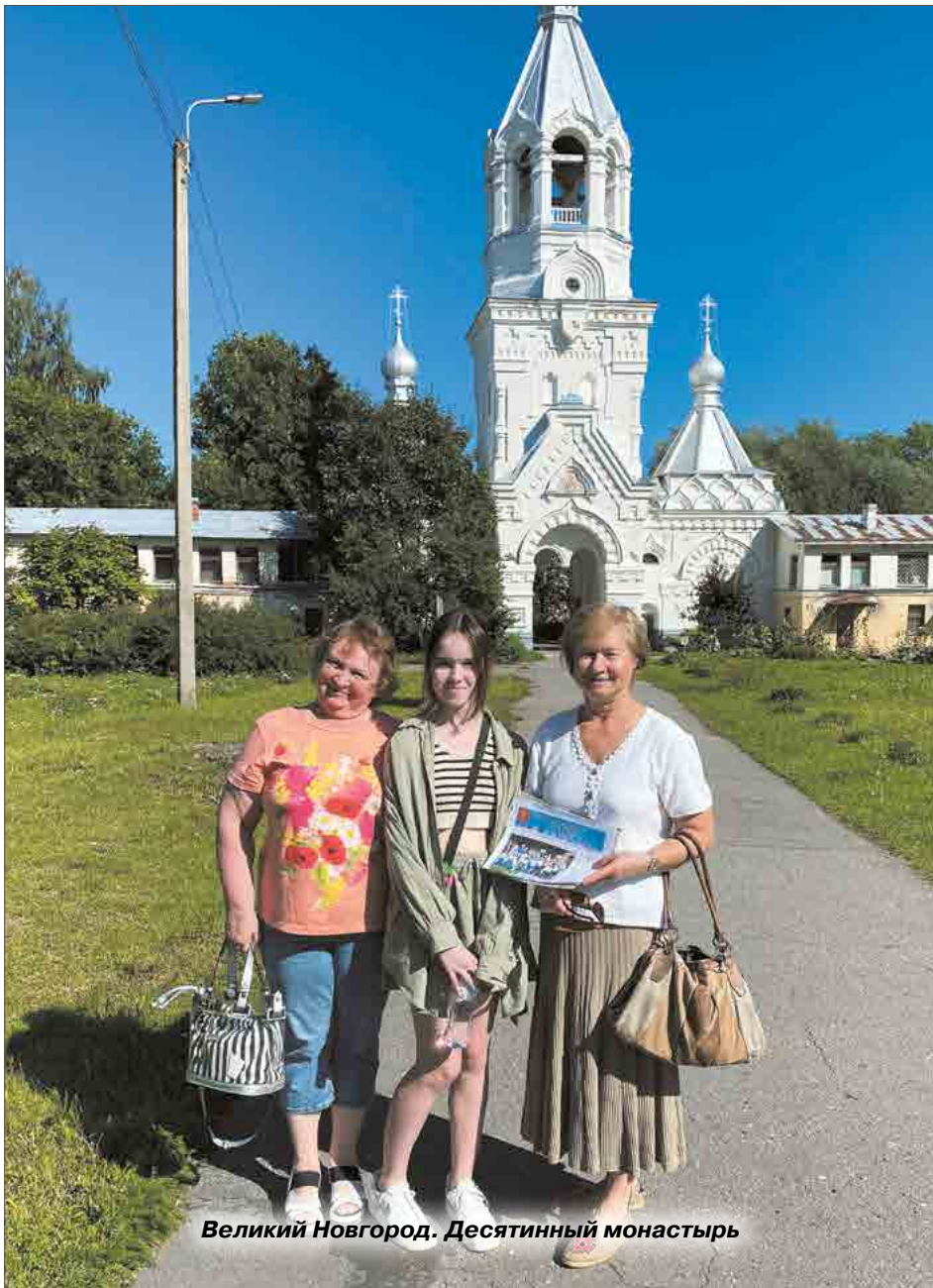
Великий Новгород. Десятинный монастырь

“Спокойной и уверенной любви Не превозмочь мне к этой стороне: Ведь капелька новгородской крови Во мне – как льдинка в пенном вине”.