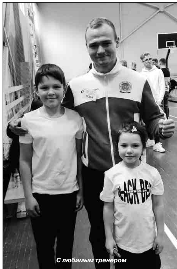
С любимым тренером