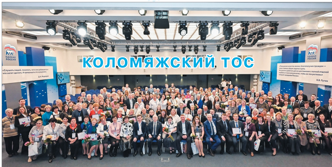
В конце ноября состоялась Стратегическая сессия местного и общественного самоуправления, организованная Общенациональной ассоциацией территориального общественного самоуправления Российской Федерации и Общероссийским Конгрессом муниципальных образований. Мероприятие собрало в Москве более 380 участников и экспертов со всей страны

Основная повестка собрания – развитие территориального общественного самоуправления (ТОС) и местных сообществ как главного муниципального актива. По словам организаторов, «ТОСы – это важная общественная база муниципалитетов!»