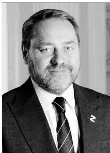
Председатель Законодательного Собрания Санкт-Петербурга Александр Бельский