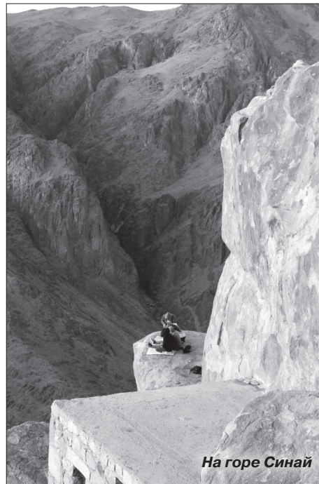
На горе Синай

У Синайского полуострова своя глубокая история, уходящая в библейские и в добиблейские глубины. На горе Синай, после исхода евреев из Египта, который, по изысканиям библеистов, случился более чем за 1000 лет до нашей эры, пророк Моисей получил десять заповедей закона Божия, общих для иудеев и христиан и мусульман. Синайский полуостров имеет особый, отличный от всего Египта, статус, вот его истоки уходят в не столь уж далекую историю арабо-израильских отношений. Арабские государства отказывались