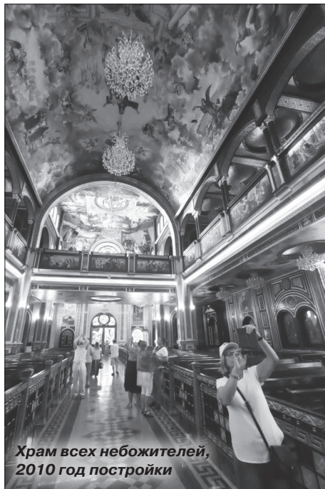
Храм всех небожителей, 2010 год постройки

В целом, тогдашнее, книжное представление о Египте оказалось в некотором противоречии с реальностью – пирамиды стоят не в пустынном месте, а рядом с многомиллионным Каиром, практически, через дорогу. Каир полон контрастов, возводятся небоскребы, а неподалеку улицы с пест, в склепах, на склепах, между склепами живут десятки тысяч людей. Многие мужчины и подавляющее большинство женщин ходят в арабской одежде – она очень удобна в этом жарком климате. Маленькая