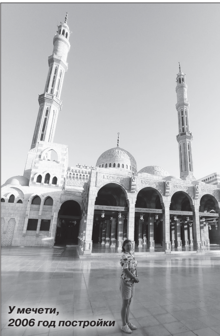
У мечети, 2006 год постройки

Пересмотр тех немногочисленных фото, сделанных еще обычным пленочным фотоаппаратом, удивительным образом помог всплыть в памяти многому увиденному и удивившему в той поездке. Замечательно четко запомнился грандиозный Луксорский храм с фигурами фараонов и обелиском Рамсеса II. Обелисков было два, а стоит один. Оба они стали дипломатическим подарком от правителя Египта, тогда еще османского, Мухаммеда Али правительству Франции. В 1836 году, после сложной транспортировки по рекам и морям, обелиск был установлен в Париже на площади Согласия, а от второго, уже в 1981 году, Франция отказалась.