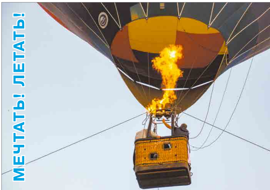
24 августа проходил Фестиваль воздухоплавания Мечтать! Летать! в Парке 300-летия Санкт-Петербурга.