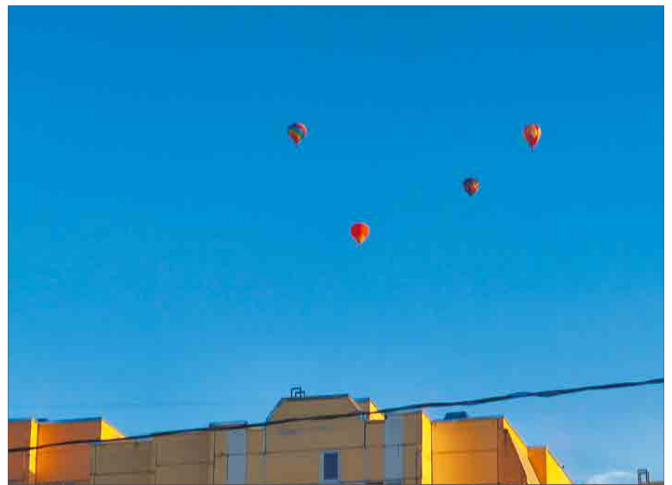
Воздушные шары над Коломьягам.