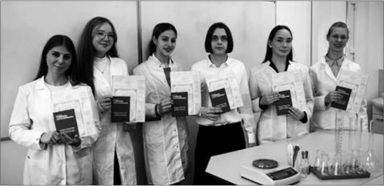
Ученики 10-11 классов, получившие первую профессию «Лаборант химического анализа»