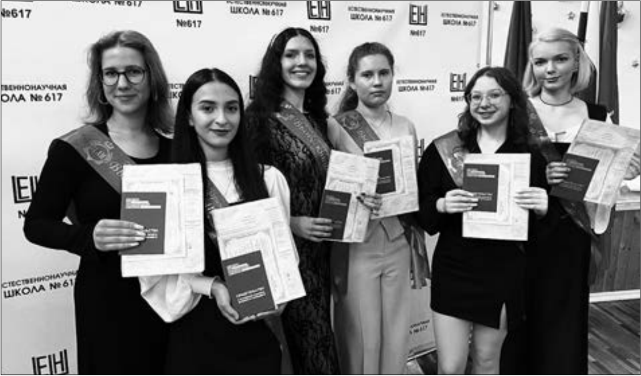
Ученики 10-11 классов, получившие первую профессию «Лаборант химического анализа»

Недавно подавала документы как выпускник прошлых лет на сдачу ЕГЭ. Сама сдавала ЕГЭ давно, хочется пройти эту процедуру в современных условиях, а то мои рассказы о сдаче экзаменов дети воспринимают как старинные предания. Для этого нужен только аттестат за 11 класс и паспорт