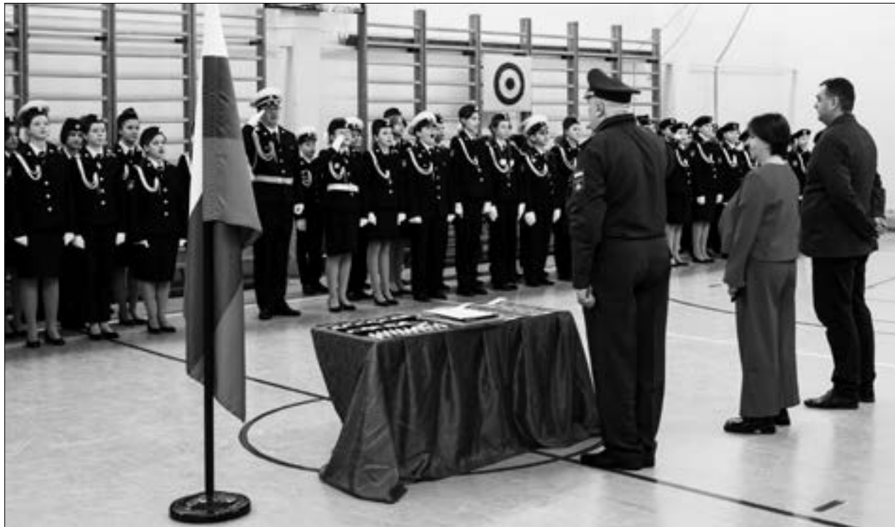
Перед волшебными новогодними праздниками в ГБОУ школе № 253 имени капитана 1-го ранга П. И. Державина состоялось торжественное награждение кадет. В атмосфере радости и гордости отличившиеся за полугодие ребята получили заслуженные благодарности, медали и почетные новые звания